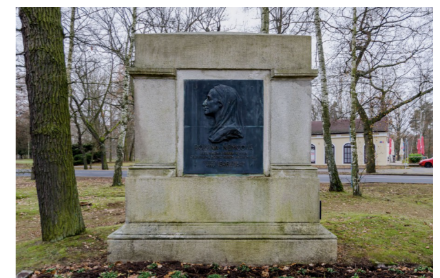
pomník B. Němcové ve Františkových Lázních

nikdo neřekl?“ Matka trhaně zakrouží hlavou, jako kdyby měla tik a vyfoukne kouř. „Jsi strašná mrcha.“