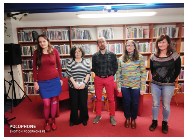
úspěšní autoři s patronkou