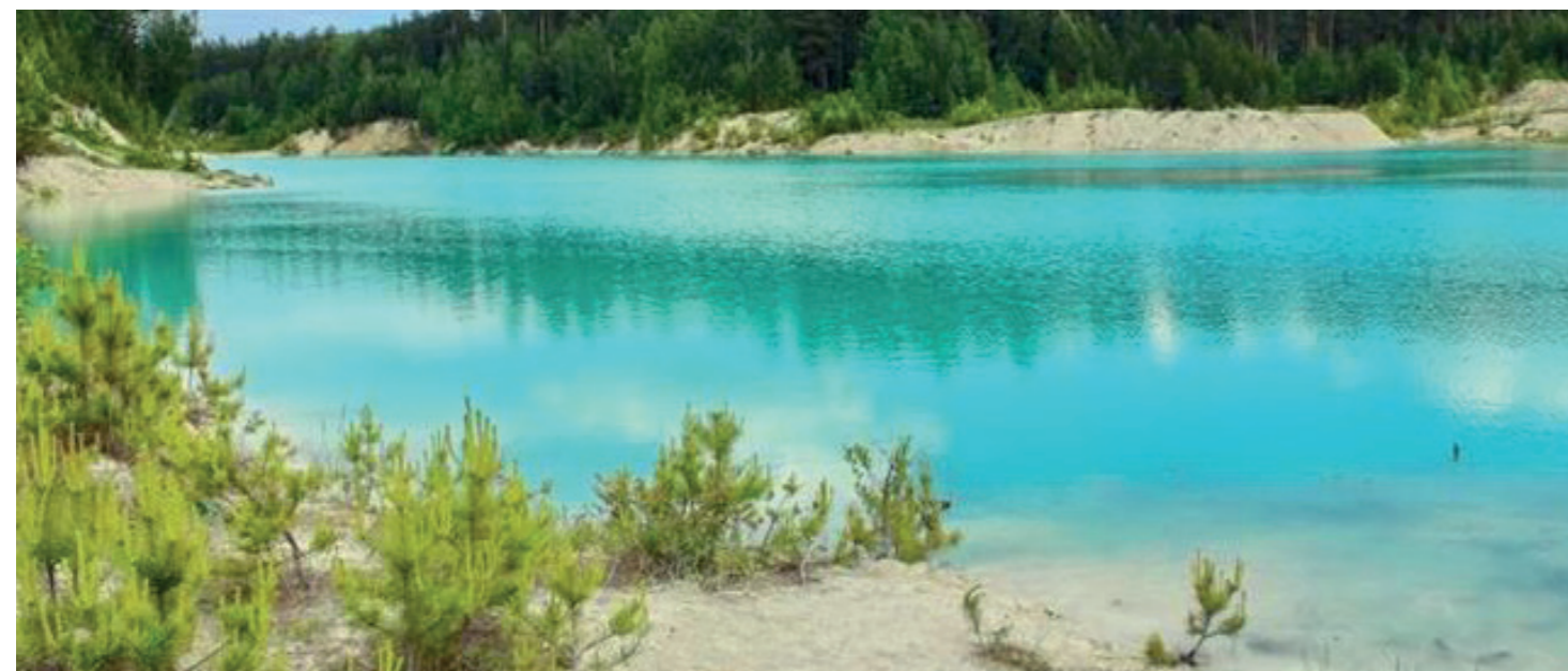
Foto: Zatopený kaolinový důl Jimlíkov

Dobrá narážka. To nebude těžké, hodně jsem toho už zmínil. V knihovnách máme pocit, že je potřeba lidem dodat vše hotové na stříbrném podnose, a pak čekáme, co oni na to. Přeskakujeme tím velmi užitečnou (a někdy i zábavnou) fází zjišťování uživatelských potřeb a kontaktu s lidmi. Jsou v obci včelaři, lidé, kteří se zajímají o krajinu, zahradníci, kteří se nemají kde scházet, chybí mateřské centrum, prostor pro mládež, kde by se cítila bezpečně, prostor pro seniory, kde by cítili uznání? Setkejme se s nimi a proberme naše potřeby a možnosti. Lidé bývají velmi schopní vytvářet užitečné věci sami, stačí jim prostor a motivace. Když to shrnu, potýkáme se s ostychem ke spolupráci. Na individuální i organizační úrovni. Mám za to, že částečně za to může systém vykazování výsledků práce. Spolupráce se prostě