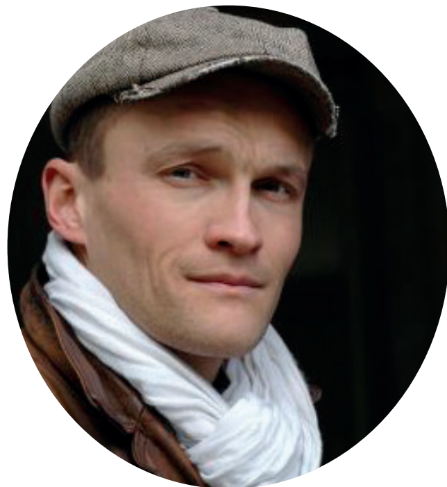
Foto: Sylvain Tesson, autor knihy